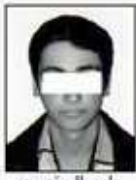
از سال، تصویر

ترم مهمانی ۲۹۱۲ | ترم تابستان سال تحصیلی ۹۱-۹۲ شماره دانشجو ۹۱۹۸۹۸۰۲ | شماره پرونده ۱۴۰۵۳۲۰